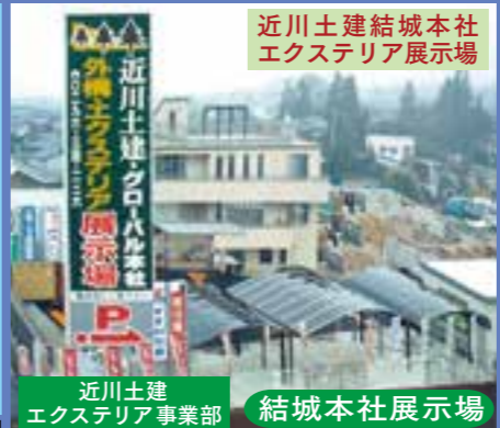
近川土建結城本社 エクステリア展示場